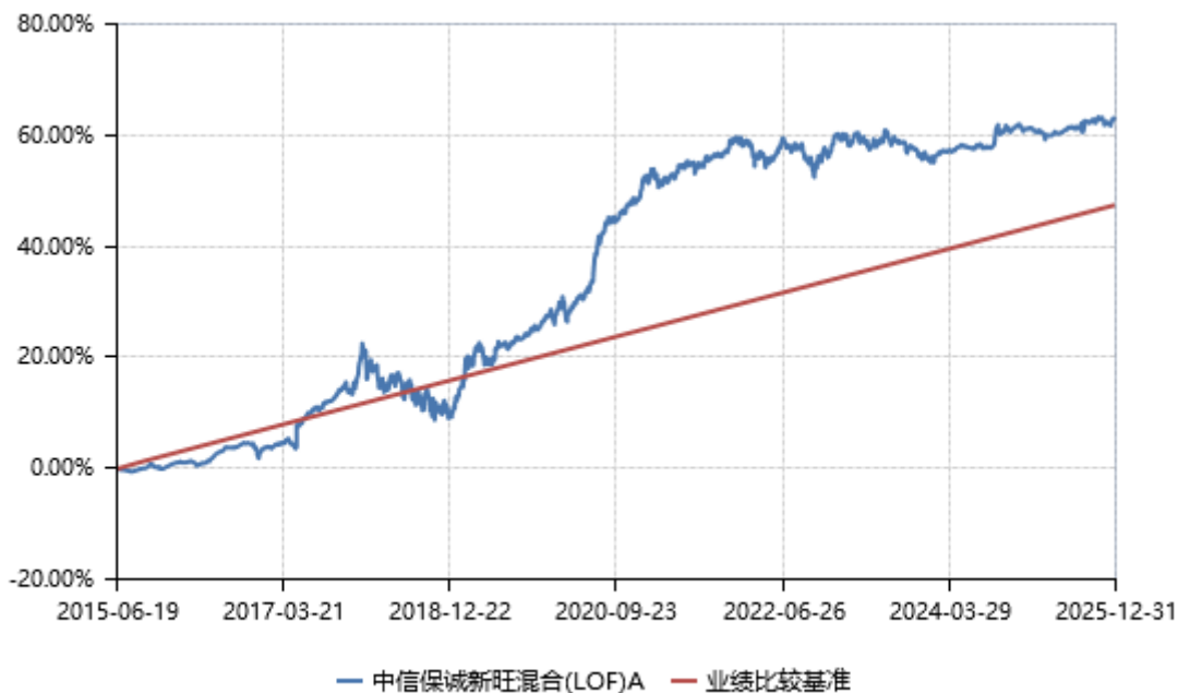
中信保诚新旺混合 (LOF) C