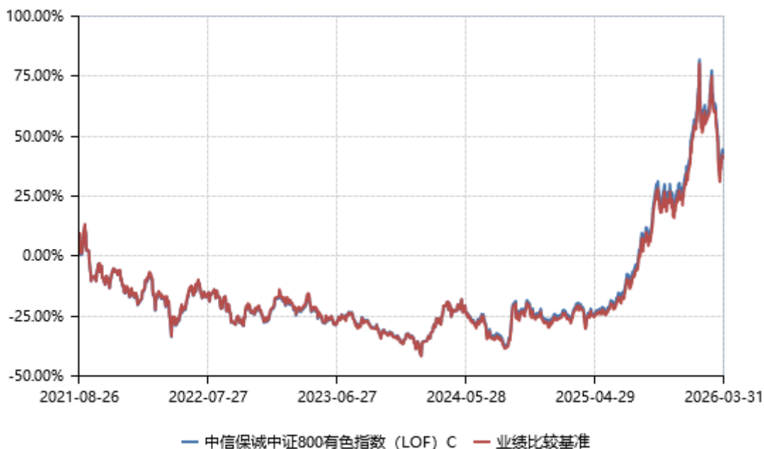
中信保诚中证 800 有色指数 (LOF) E