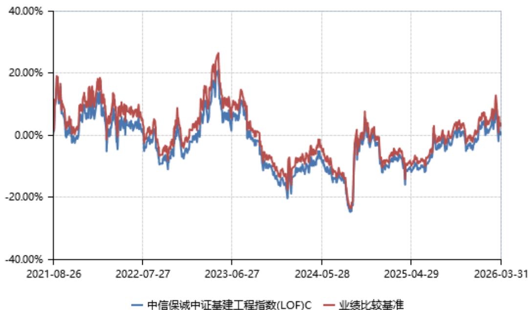
中信保诚中证建筑工程指数(LOF)E