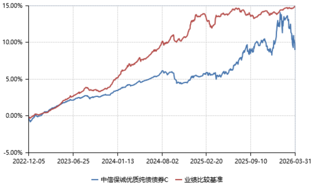
中信保诚优质纯债债券 D