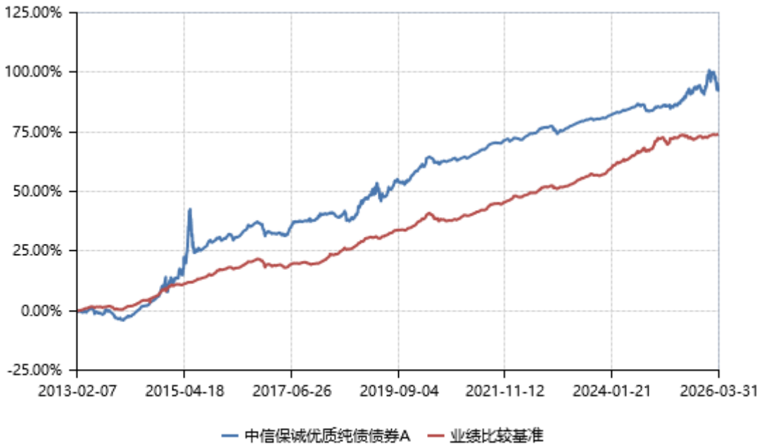
中信保诚优质纯债债券 B