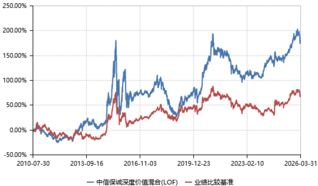
（二）基金累计净值增长率与业绩比较基准收益率的历史走势对比图